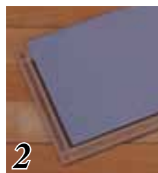
2 アロックサイレントシステム