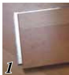
1 アルミニウムロックシステム